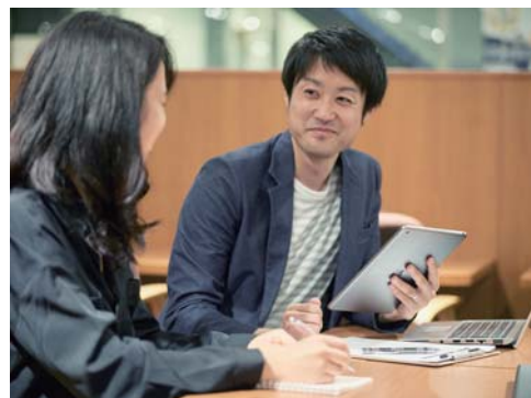
働き方改革と生産性向上を実現

「働き方改革と生産性向上を実現する、デジタルドキュメント」をテーマにした特別講演や実践事例など、非常に興味深い内容のセミナーです。是非、ご来場ください。