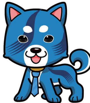
ジムマネジメントの企業キャラクター“ジムくん”。皆様に愛される企業を目指して考案された。

ということです。ホストコンピュータを動かしたり、データをエントリーしたり、画像を作るスキニングをすることも全て行うのは人がキーになっています。そのため、従業員にはとにかく1日でも長く働いていただきたいと思ったり、もっと働きたいと感じていただくのが一番の願いかなと考えています。私たちがこだわる『働く幸せ』は“愛されること”“褒められること”“お役に立つこと”“必要とされること”であり、この4つのマインドは仕事を通じて得られると考えています。