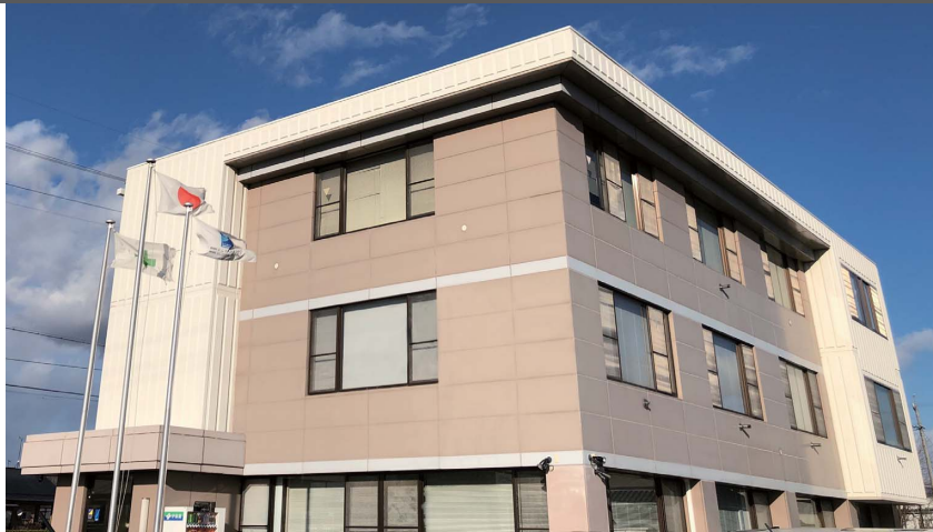
長野BPOセンター（長野県佐久市）