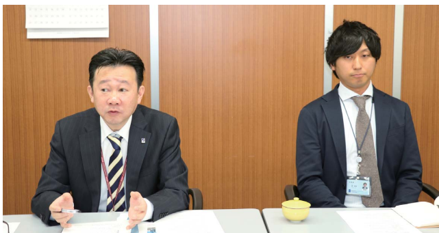
従業員も満足、お客様も満足、そうすれば会社も満足する。その3つの満足を大切にしていきたい。

結果的に、内需拡大が見込めず仕事の奪い合いが激しくなってしまう部分は避けられませんから、そういう部分に対抗していくにはどうしようか、また少子高齢化による労働力不足など、今後どういうふうに残りをかけてやっていくのか、その中でステップアップしていくために、JIIMAに加入して人工知能(AI)や次世代通信(5G)を含めた新しい技術革新情報を収集して事業の裾野を広げていきたいと思っています。