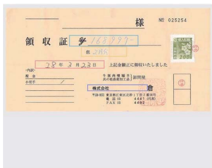
※手書き領収書の文字も認識できます。