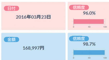
領収書の電子化例