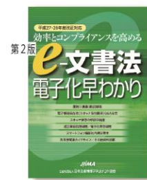
e-文書法 電子化早わかり 第2版