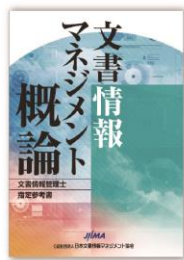
文書情報マネジメント 概論