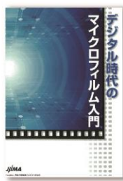
デジタル時代の マイクロフィルム入門