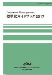
標準化ガイドブック2017