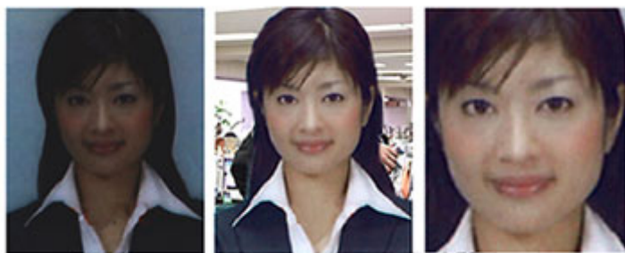
・全体に暗い ・背景が単色でない ・顔がはみ出している