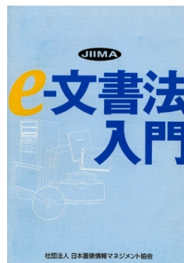
e-文書法入門 JIIMA 編 A5・56 頁 1,200 円 平成 17 年 11 月刊