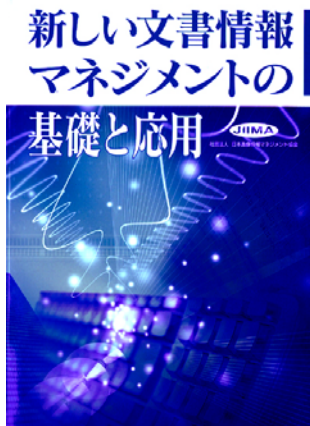
新しい文書情報マネジメントの基礎と応用 JIIMA 編 B5 234 頁 5,000 円 平成 22 年 5 月刊