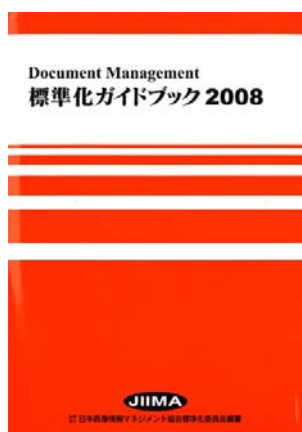
標準化ガイドブック 2008 (改訂版) JIIMA 編 B5・414 頁 5,000 円 平成 21 年 5 月刊