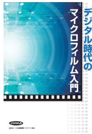
デジタル時代のマイクロフィルム入門 JIIMA 編 B5 76 頁 2,500 円 平成 23 年 4 月刊 (第 1 版) 2011 年 8 月試験からはこの 参考書を使用しています。